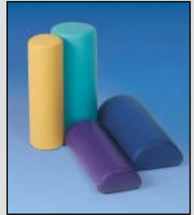
Lagerungsmaterial: Rund- und Halbrollen