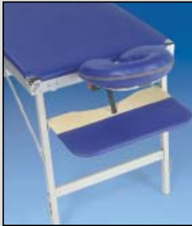
Kopfteil-Version mit U-Kissen zum Einstecken plus Armauflage, stufenlos höhenverstellbar